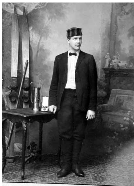
Sněžka, 24. února 1907.

který nám jednou večer před spaním na horách Atri vyprávěl.