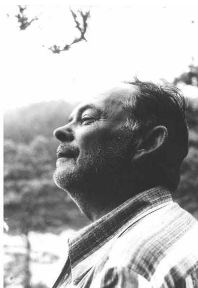
Na konci tábora Povltaví 1985