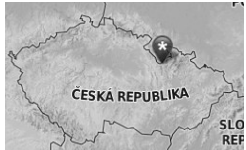
Prostřední Lipka nedaleko Králíků

12 tam, kam vás republika postavila. Naším společným heslem budiž NEPROJDOU „